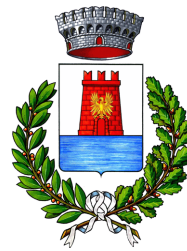
Comune Castellammare del Golfo